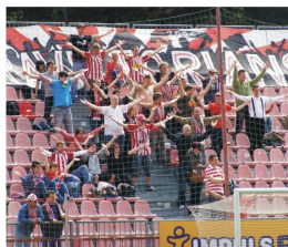
Věrní fans hráčům Viktorky po zápase poděkovali i přes ztracené tři body v samotném závěru.