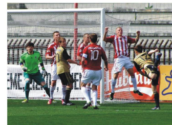
Podobné situace byly k vidění po celý zápas na obou stranách