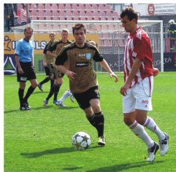
Nepožitek odehrál opět kvalitní utkání